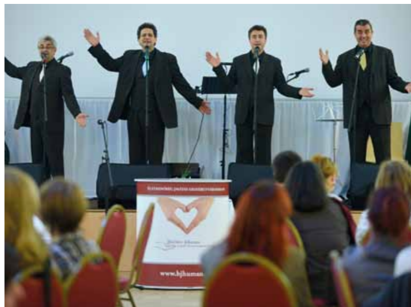
Four Fathers Singers együttes lépett fel a rendezvényen