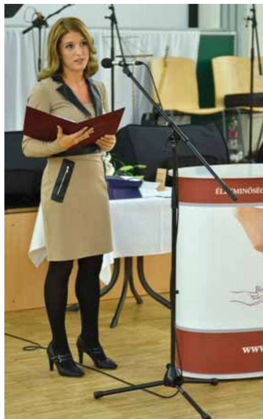
Dr. Vető Marietta alpolgármester mondott ünnepi beszédet

Dolgozzon valaki ápolóként, család-gondozóként vagy egyéb segítőként, munkája nélkülözhetetlen az egyének, a családok és a társadalom szintjén is. Mindezek ellenére az ágazatban dolgozók gyakran szembesülnek azzal, hogy nem kapnak méltó megbecsülést. A szociális munka napjának megünneplése éppen ezért kiváló alkalom a biztosit arra, hogy elismerjük a szociális szakma területén dolgozó kollégák felelősségteljes, áldozatos munkáját. Erzsébetvárosban idén november