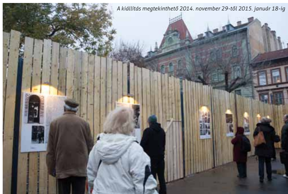
A kiállítás megtekinthető 2014. november 29-től 2015. január 18-ig

Kérjük, látogasson el időszakos kiállításunkra, és adja le szavazatát az Önt leginkább megérintő művészre vagy alkotásra!